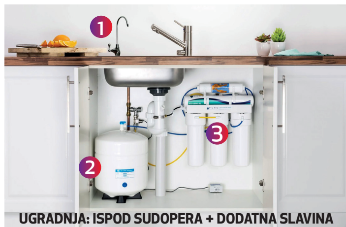
UGRADNJA: ISPOD SUDOPERA + DODATNA SLAVINA